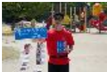
チャリティランナー募金ツール