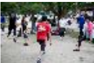
チャリティランナー向けランニング定期練習会