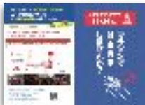
大会PR用パンフレット（4P構成）