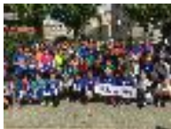
なないろ合同練習会

紺色のプール・ボランティアさんと協力して、なないろ合同セミナーや紺色PRラン、九州からの出走者を対象としたランニング練習会・セミナーなどを開催しました。