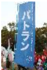
活動時に利用するのぼり（紺色バージョン）