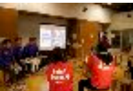
チャリティランナー壮行会