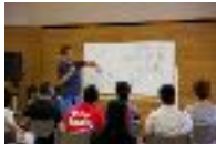
チャリティランナー向けランニングセミナー