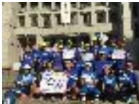
紺色PRランニングin御堂筋