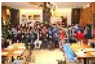
大会終了後のチャリティランナー打ち上げ&懇親会